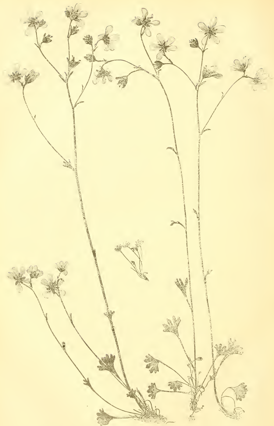
Saxifraga granulata L. \times decepiens Ehrh. var. sponhemica (Gmel.) = S. Freibergii Ruppert.