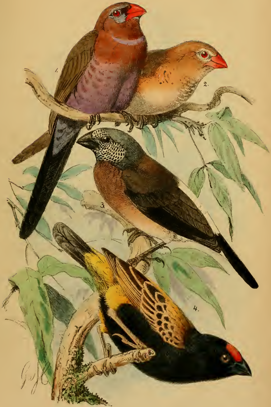
1. 2 Uraeginthus ianthinogaster . 3. Pitylia caniceps 4 Euplectes diadematus.