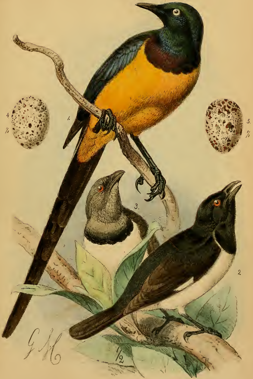
1 Cosmopsarus regius 2.3. Speculipastor bicolor