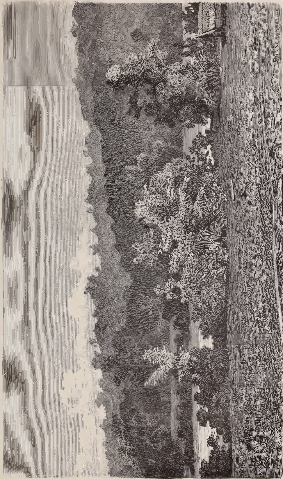
D. D. Veth phot.