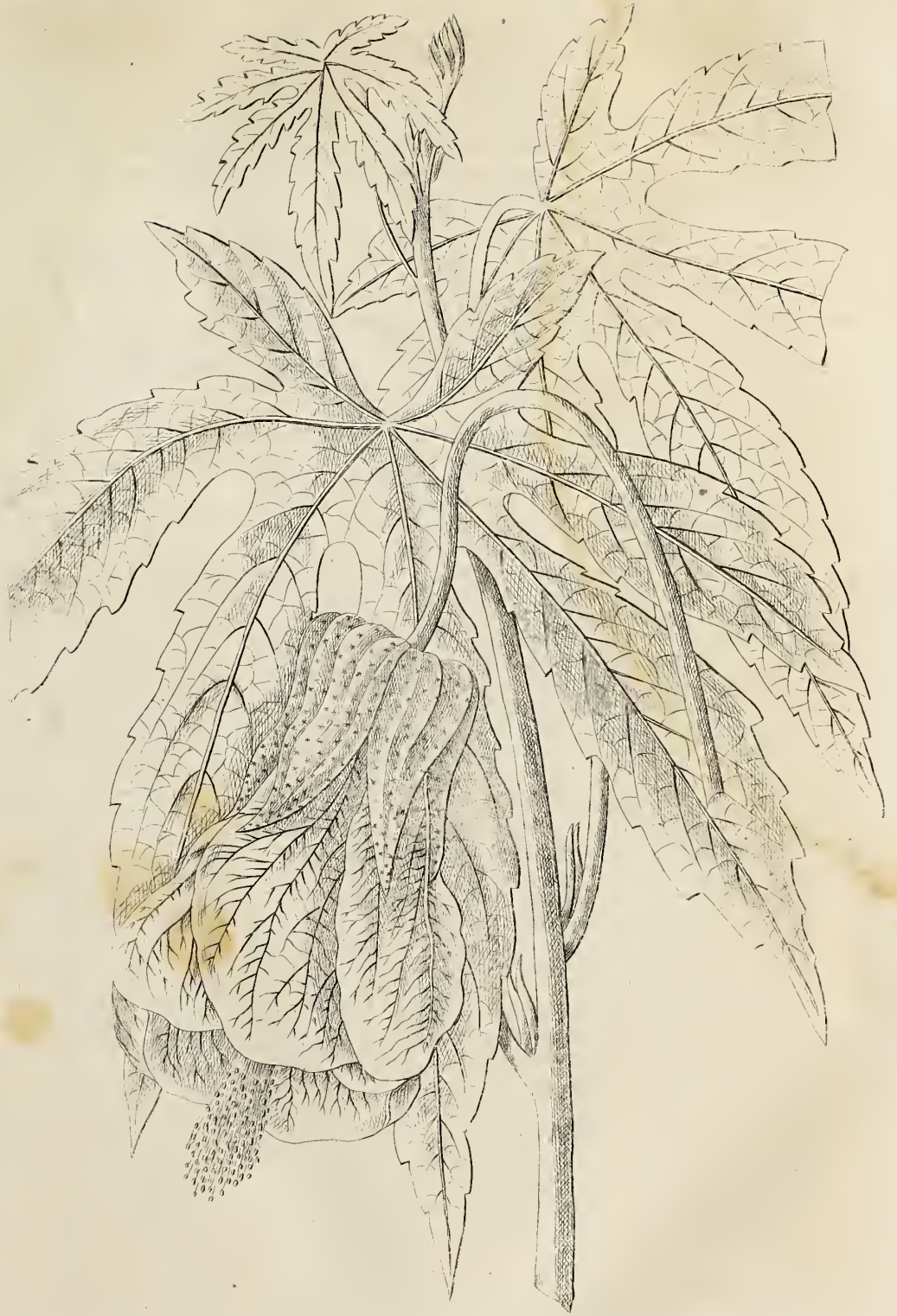
Abutilon venosum Nob. ( Abutilon venosum Martini)