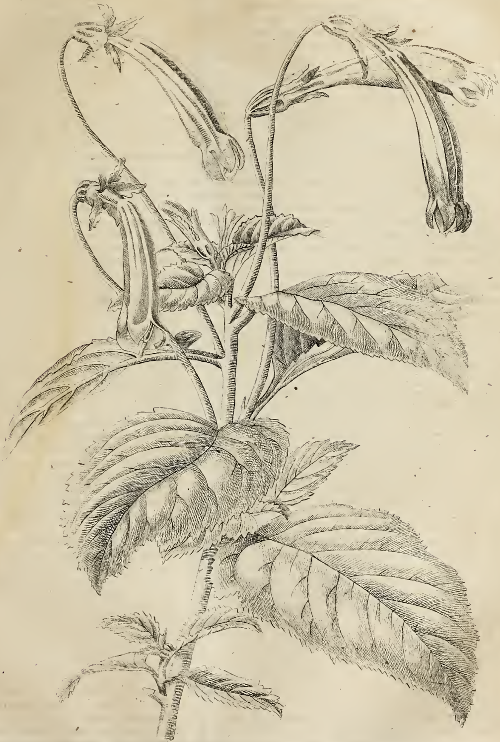
Sida campylota Hook.