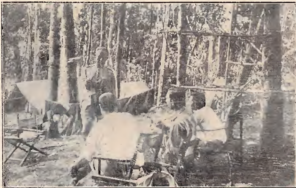
Pouso do Breu — Rio Cuminá