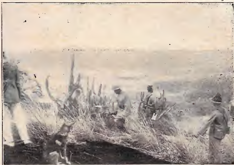
Alto do Pico Ricardo Franco — Serra Tumuc-Humac