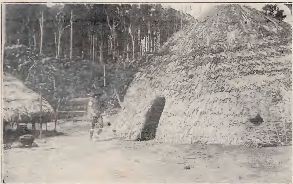
Maloca dos Indios Pianogotós no Rio Cuminá