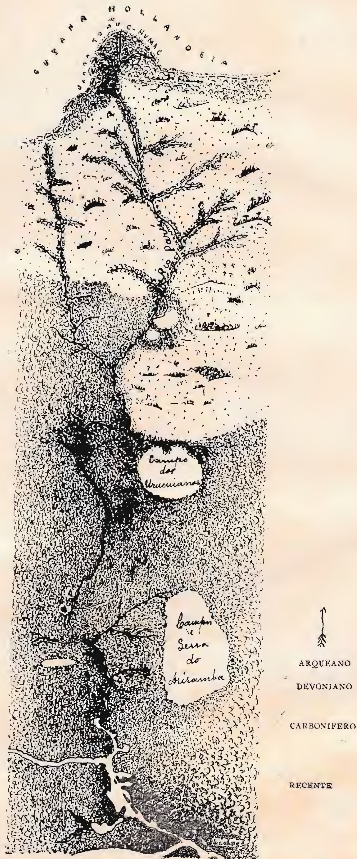
Croquis do Rio Cuminá, segundo Mappa Topographico do Dr. Benjamin Rondon