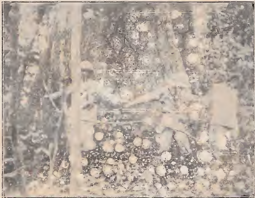
A base de uma castanheira ( Bertholletia excelsa ) na mata do Mel, Rio Cuminá