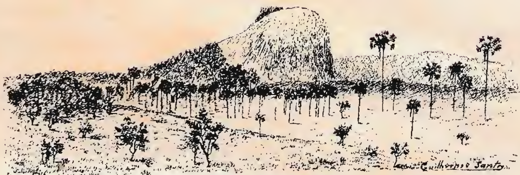
Pico Ricardo Franco

Primeiro Pico ao Sul da Serra Tumucumac Seg. Photoq. do D r Benjamin Rondon