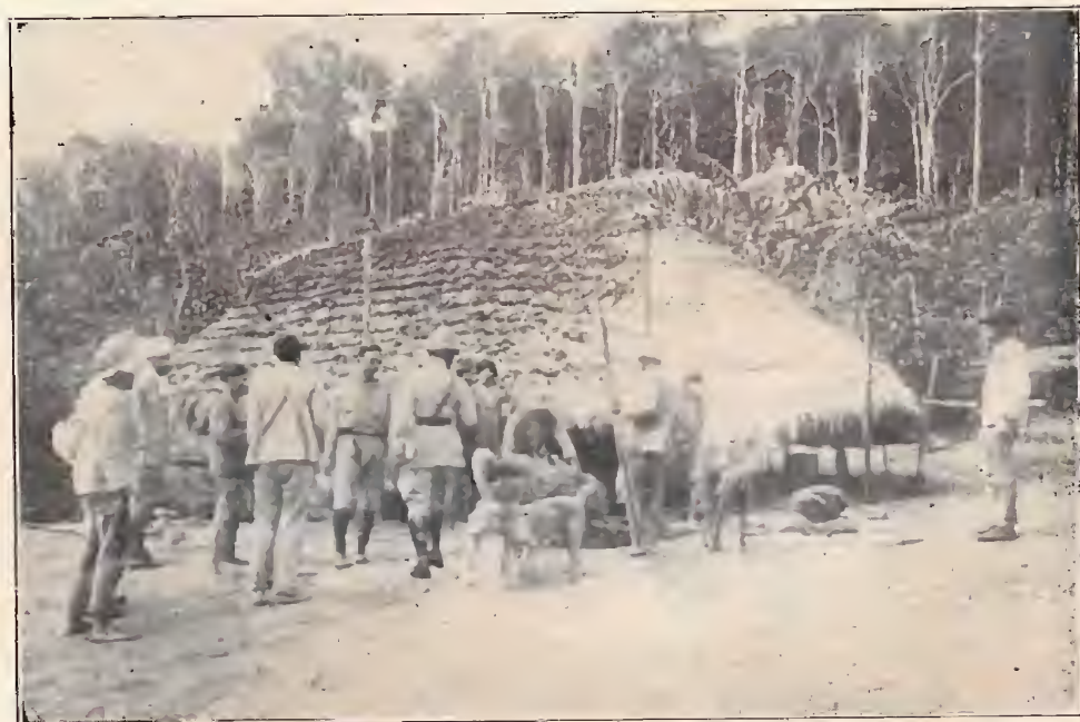
Maloca dos Pianogotós — Rio Cuminá