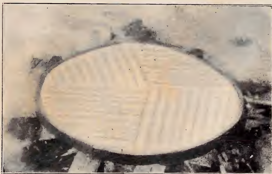
"Bijú" dos Índios Rangús — Serra Tumuc-Humac