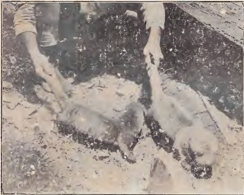
Jovens ariranhas, do Rio Cuminá