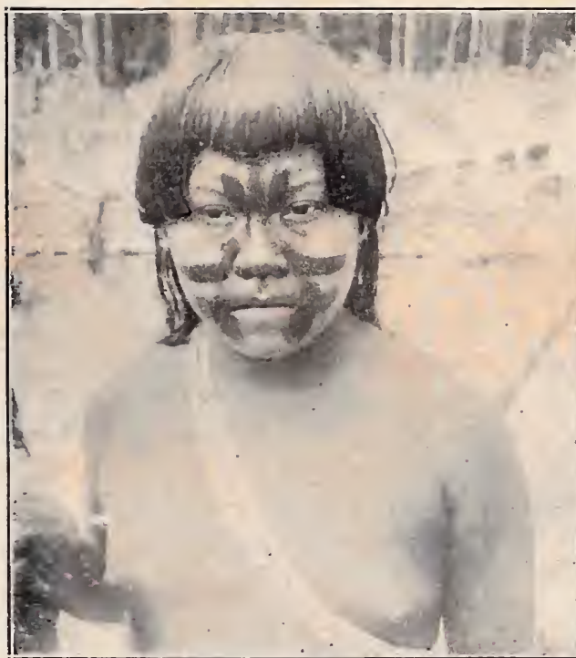
Um indio Pianogotó — Rio Cuminá