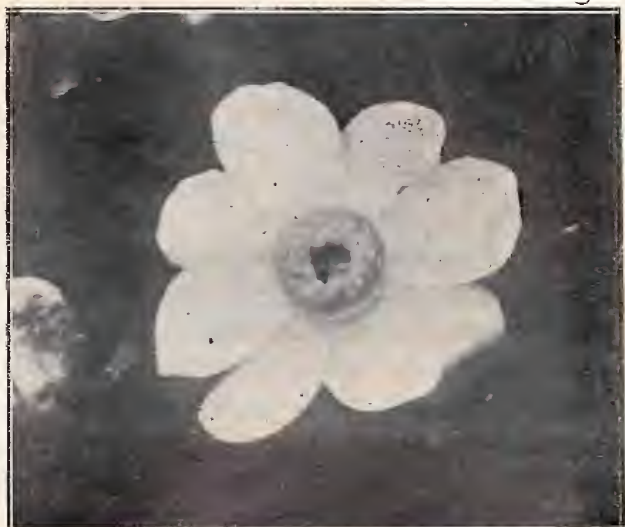
Flor de Geniparana ( Gustavia pterocarpa ) Arvore da mata do Rio Cuminá