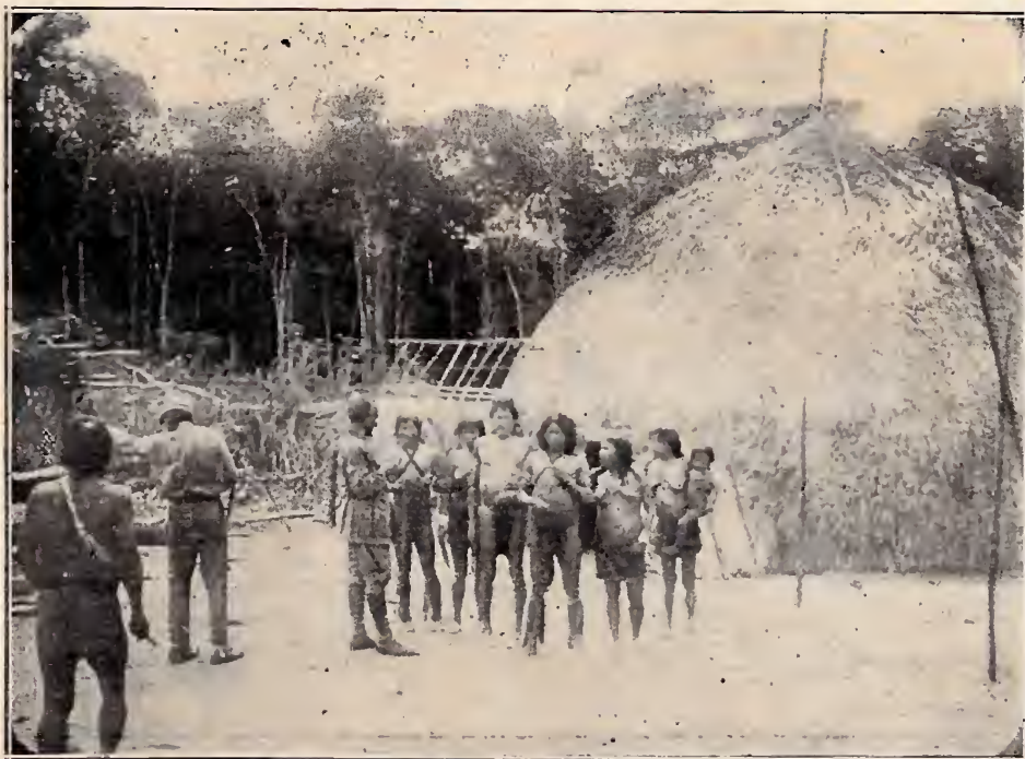
Visita do General Rondon á maloca de indios Pianogotós — Rio Cuminá