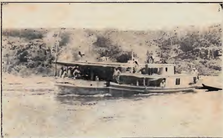
A lancha "Amazonina" amarrada ao batelão