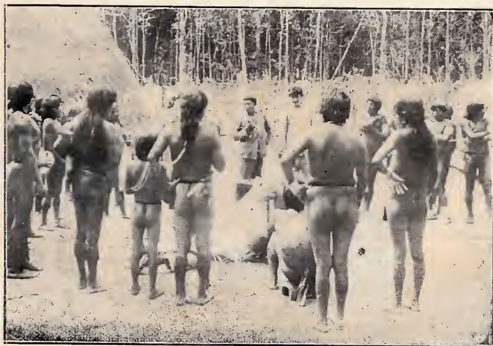
Indios Pianogotós, no Rio Cuminá, na troca de artefatos