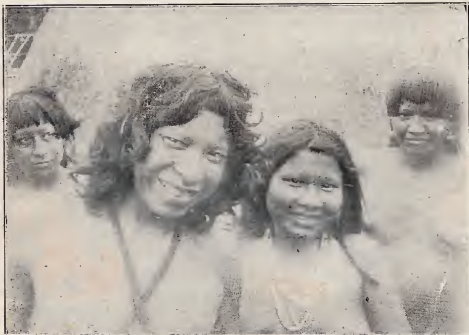
Indios Pianogotós — Rio Cuminá