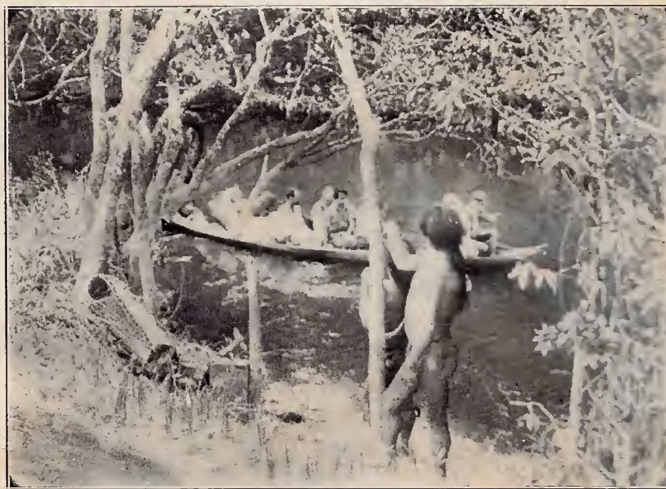
Indio Pianogotó á beira do rio Cuminá, despedindo-se da Comissão Rondon