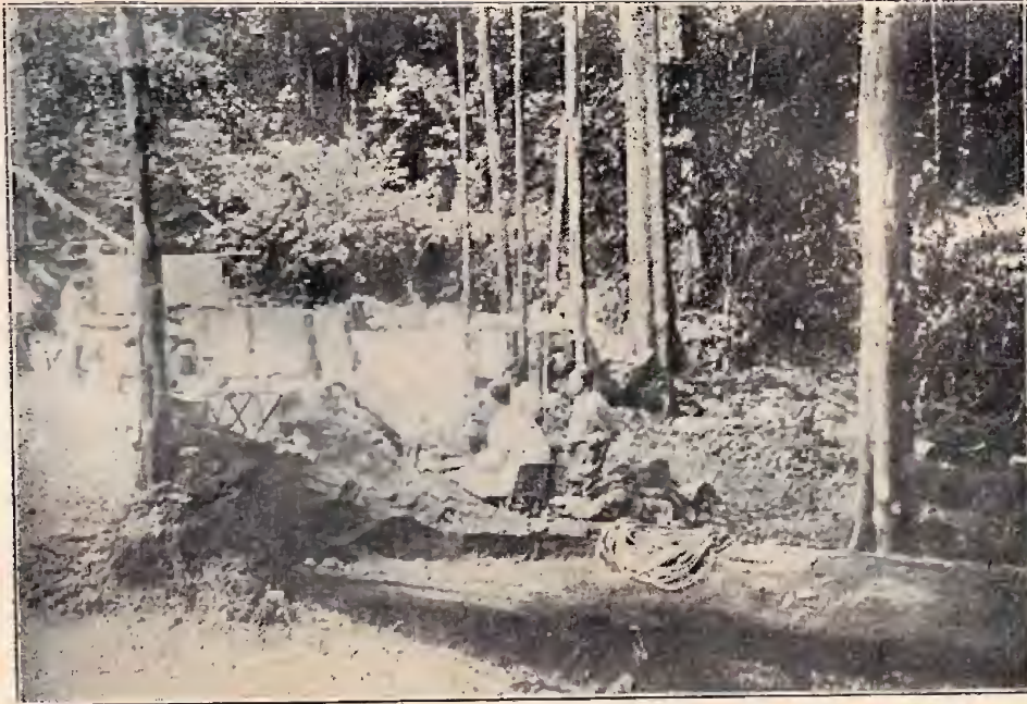
Um trecho da Mata do Mel — No Rio Cuminá