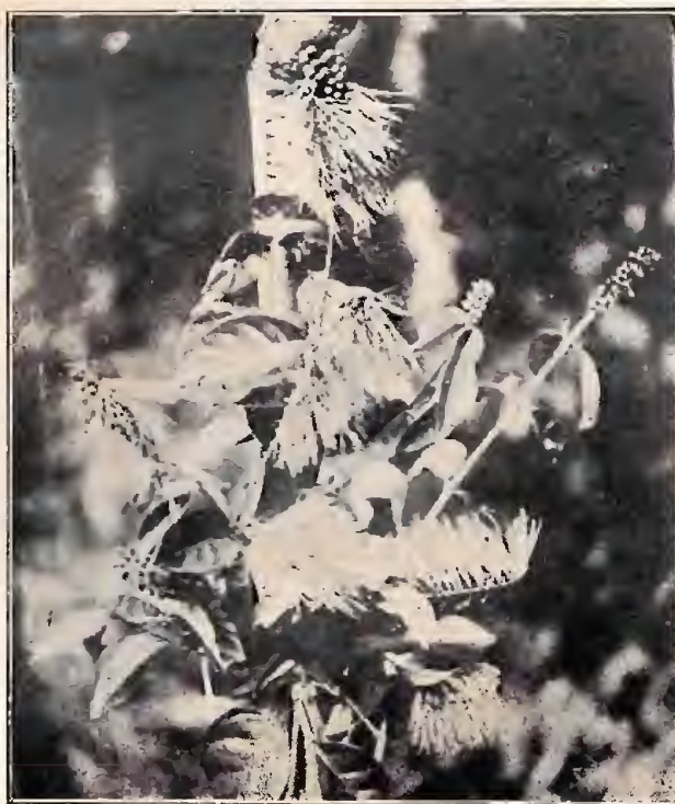
"Escova" ( Combretum Aubletii ) Rio Cuminá