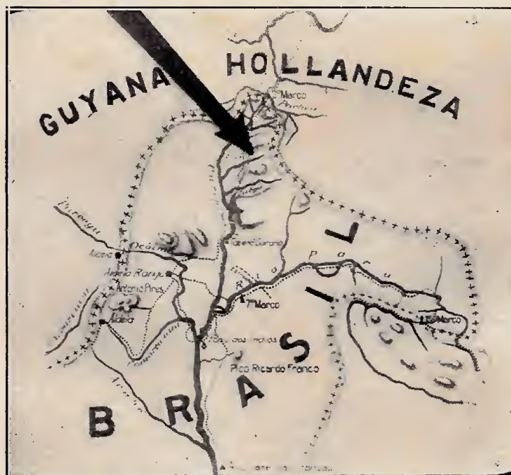
Pontos extremos da Expedição Rondon, na Serra Tumuc-Humac