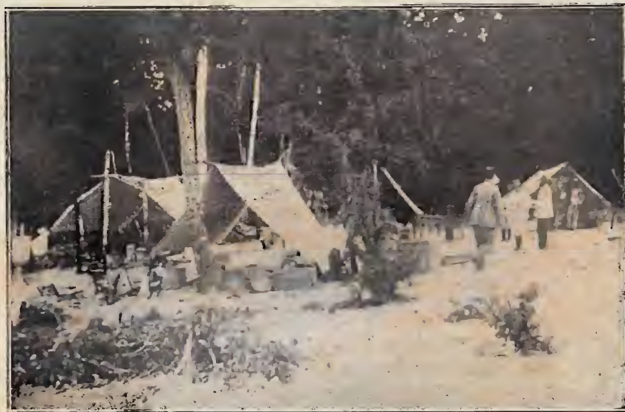
Primeiro acampamento, na "Pancada" - Rio Cuminá, E. do Pará