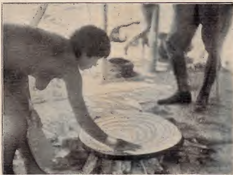
Preparando o "bijú" — Índia Rangú — Serra Tumuc-Humac