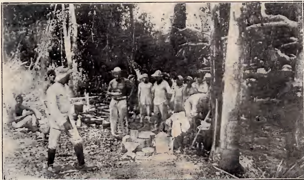
O Rancho, no Pirarara — Rio Cuminá